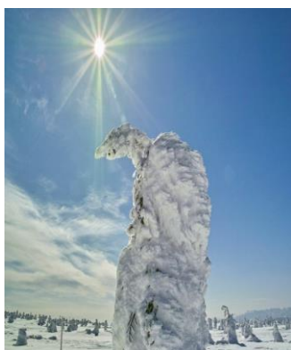
蔵王のアイスモンスター

自分のことは自分で面倒を見る風潮が強まる中、自宅売却前提の制度は今後注目されていくかもしれません。