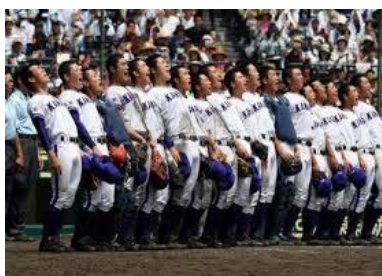
金足農業高校準優勝おめでとう 全力校歌斉唱は凄すぎて感動!!

火災保険に加入する場合は、建物だけの補償だけでは生活の立て直しに多額の費用が発生します。家財の補償も忘れずに、そして、地震保険もそれぞれ加入することをお勧めします。