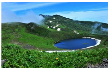
夏の鳥海湖 鳥海山の登山適期は7～10月

登山は、「つらい・大変・きつい」といったイメージがありますが、日常とかけ離れた大自然に身を置くだけで清々しい気持ちになり、山の澄んだ空気を吸えば心も体もリラックスできることでしょ