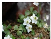
チョウカイフスマ