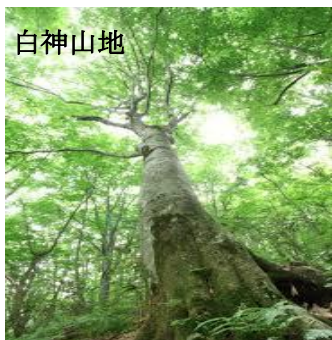
青森県と秋田県にまたがる世界遺産 森林浴で心と体を癒したいですね