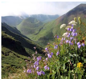
花の名山として名高い 秋田駒ヶ岳