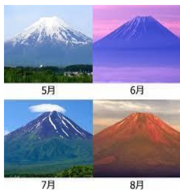
山に親しみ山の恩恵に感謝！ 8月11日「山の日」誕生