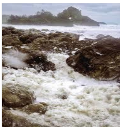
日本海冬の風物詩 波の花

子供が免許を取得した際や家族構成が変わった場合などはその都度条件を見直し、うっかり対象外の人が車を運転することのないように、車ごとに誰が補償の対象となっているか常に把握しておくことが大切です。