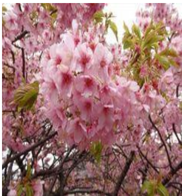
伊豆の河津桜 開花から落花まで1カ月と とても長く見られます