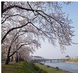
お花見スポット 仙北市桜木内川堤の ソメイヨシノ 2 kmに及ぶ桜のトンネル

条件を満たせば利用できる制度があり、割安な保険料での加入が可能です。利用できるかどうかチェックしてみましょう。