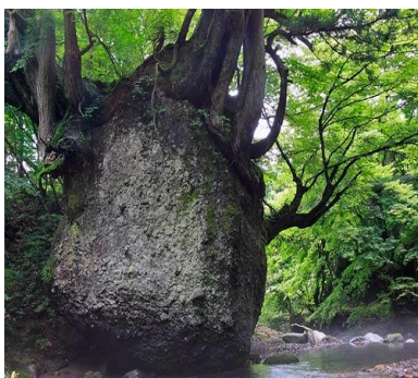
五城目町「ネコバリ岩」 約6mの巨岩に何本もの巨木が根を張って地面と繋がっている マイナスイオンを感じるスポット！

因みに、トンチン性の高い年金といえは、「公的年金」です。100歳まで生きた場合の返戻率は約6.6倍という高さです。