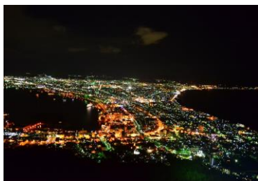
8/13は「函館夜景の日」 函館市南部にある標高334m の函館山の山頂から観る夜景

「車両無過失事故に関する特約」は車両保険に自動セットになっている場合が殆どですが、中にはオプションとして付帯する場合がありますので保険会社等にご確認下さい。