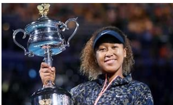
優勝を「コロナと闘っている世界中の人々」と、東日本大震災で「今なお困難に立ち向かっている日本の方々」に捧げる！と感謝のメッセージ